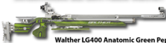
Walther LG400 Anatomic Green Pepper

Bewährte Walther Qualität zum unschlagbaren Buinger-Preis